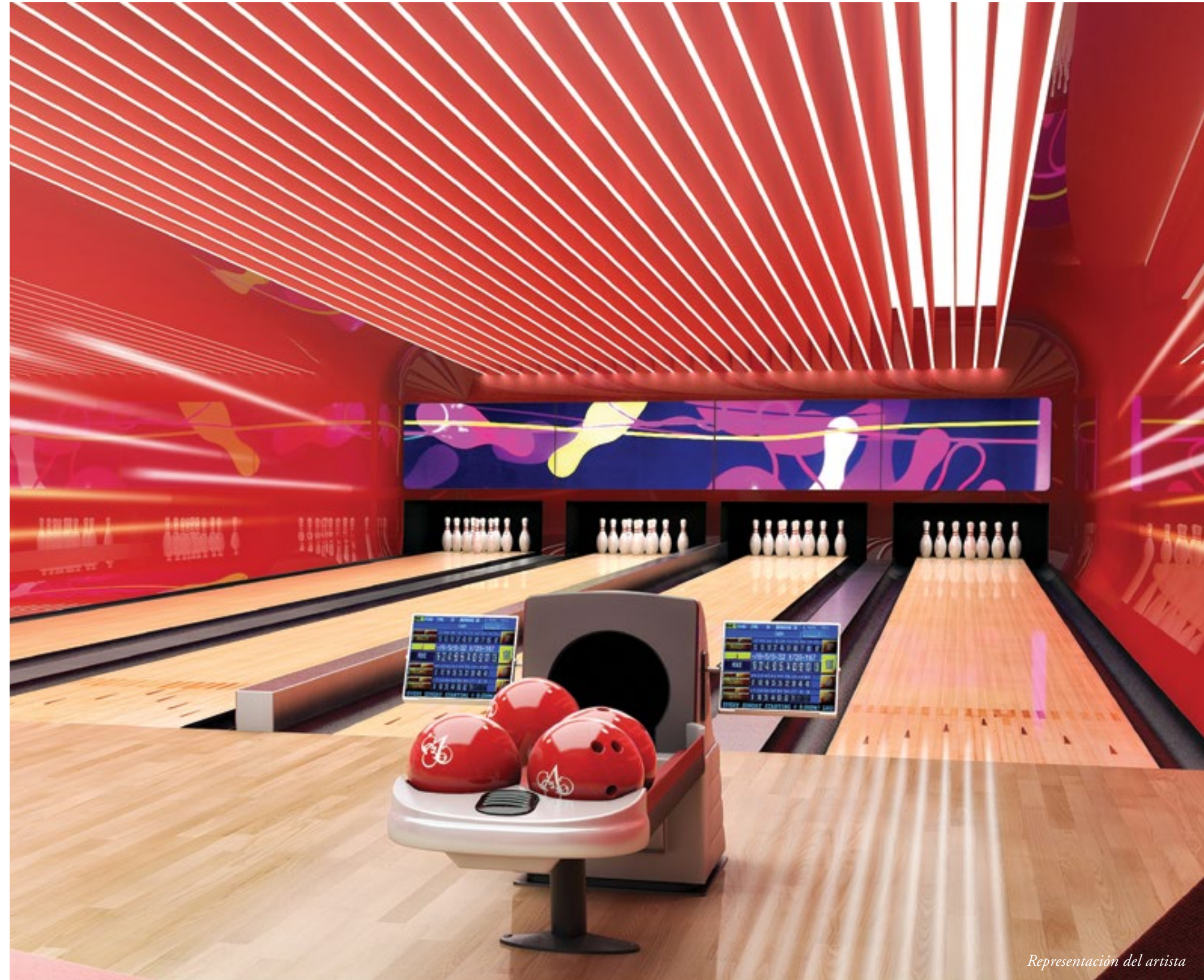
VILLA ACQUALINA tiene CUATRO PISTAS DE BOLOS