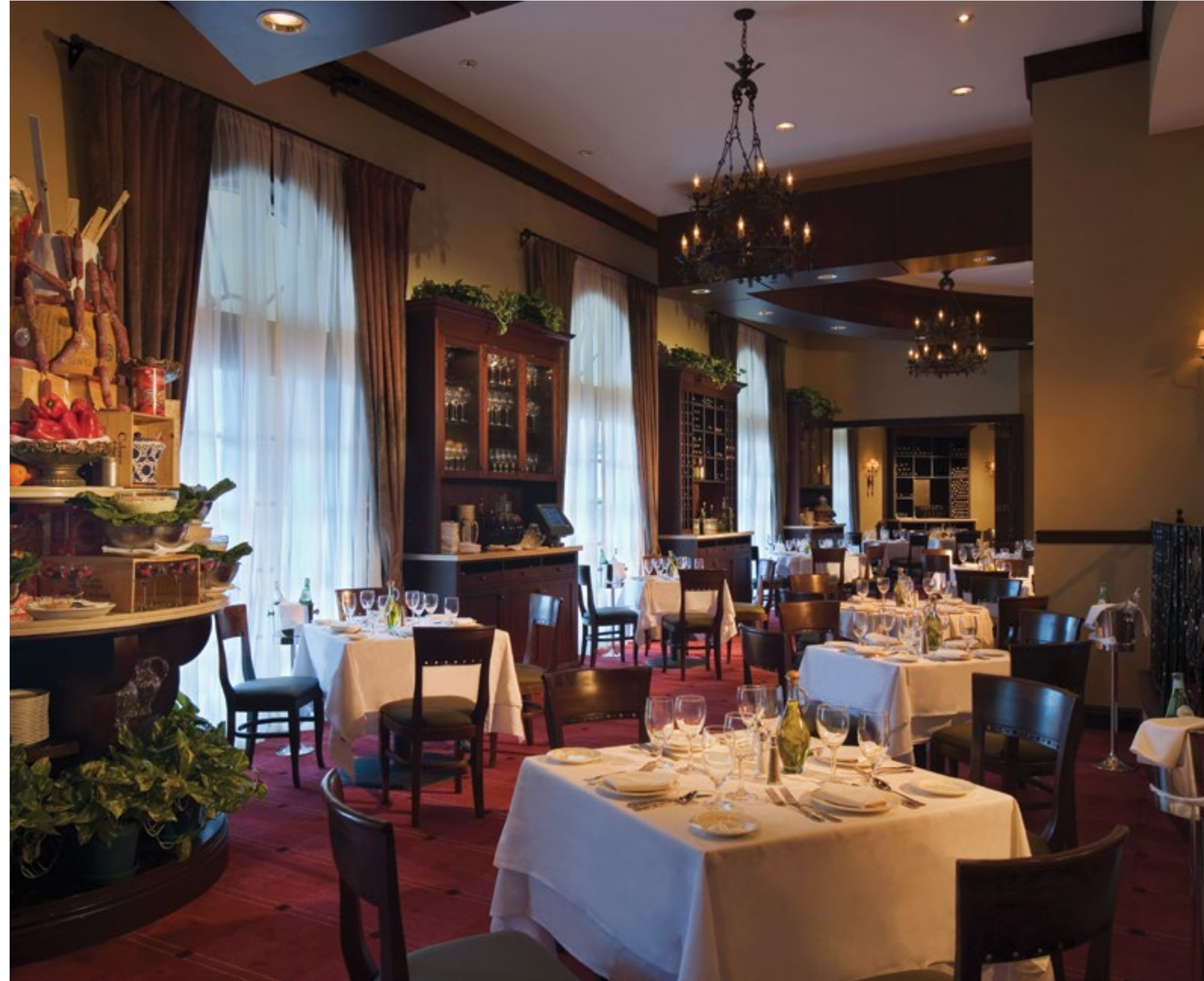
RESTAURANTE IL MULINO NEW YORK