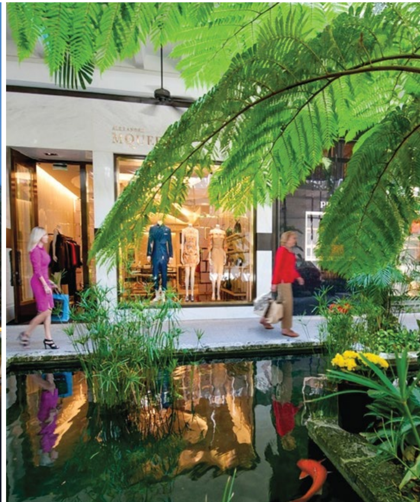
BAL HARBOUR Shops