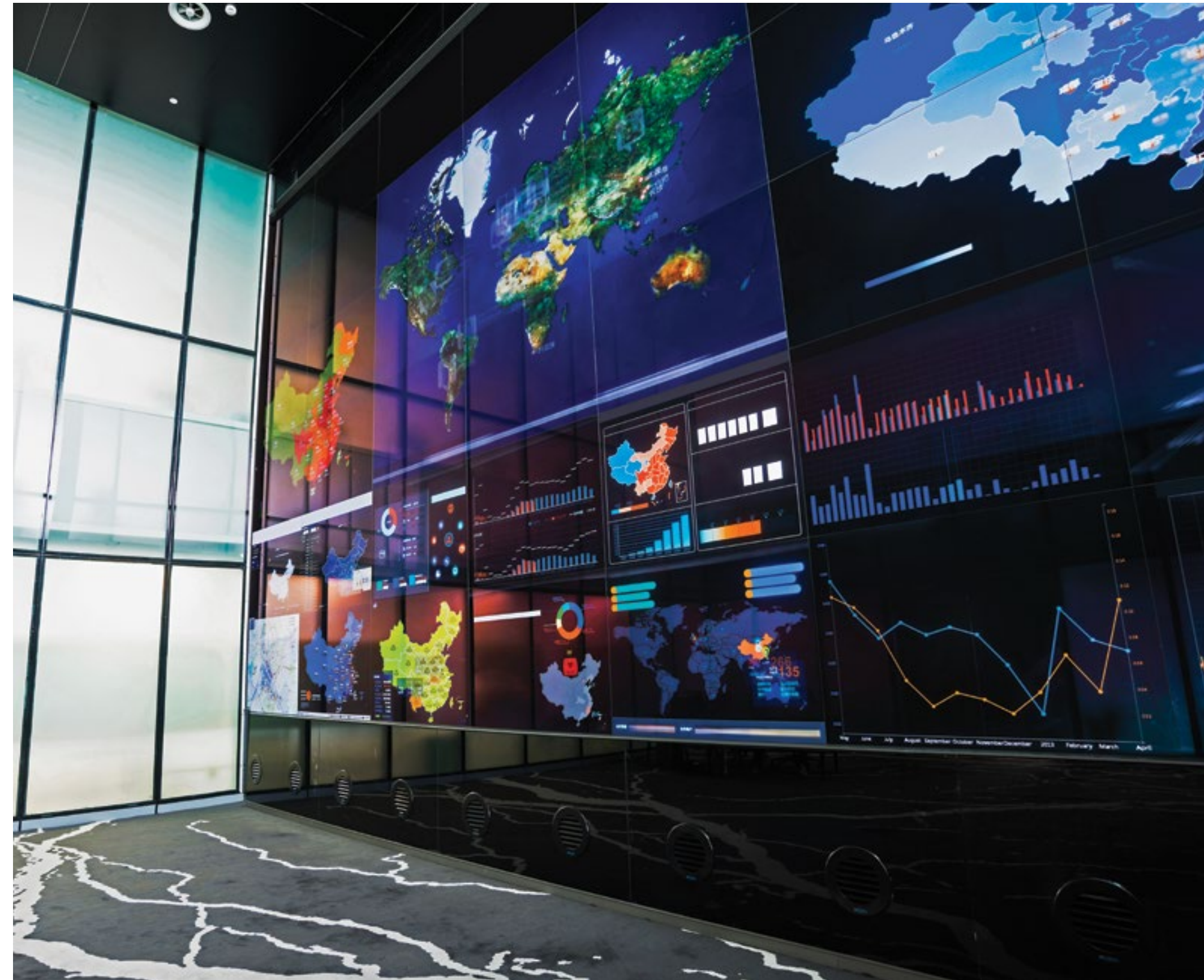
EL SALÓN DE INVERSIONES DE WALL STREET, donde puede comprar, vender e intercambiar