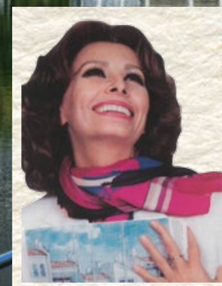
SOPHIA LOREN, portavoz de WILLIAMS ISLAND