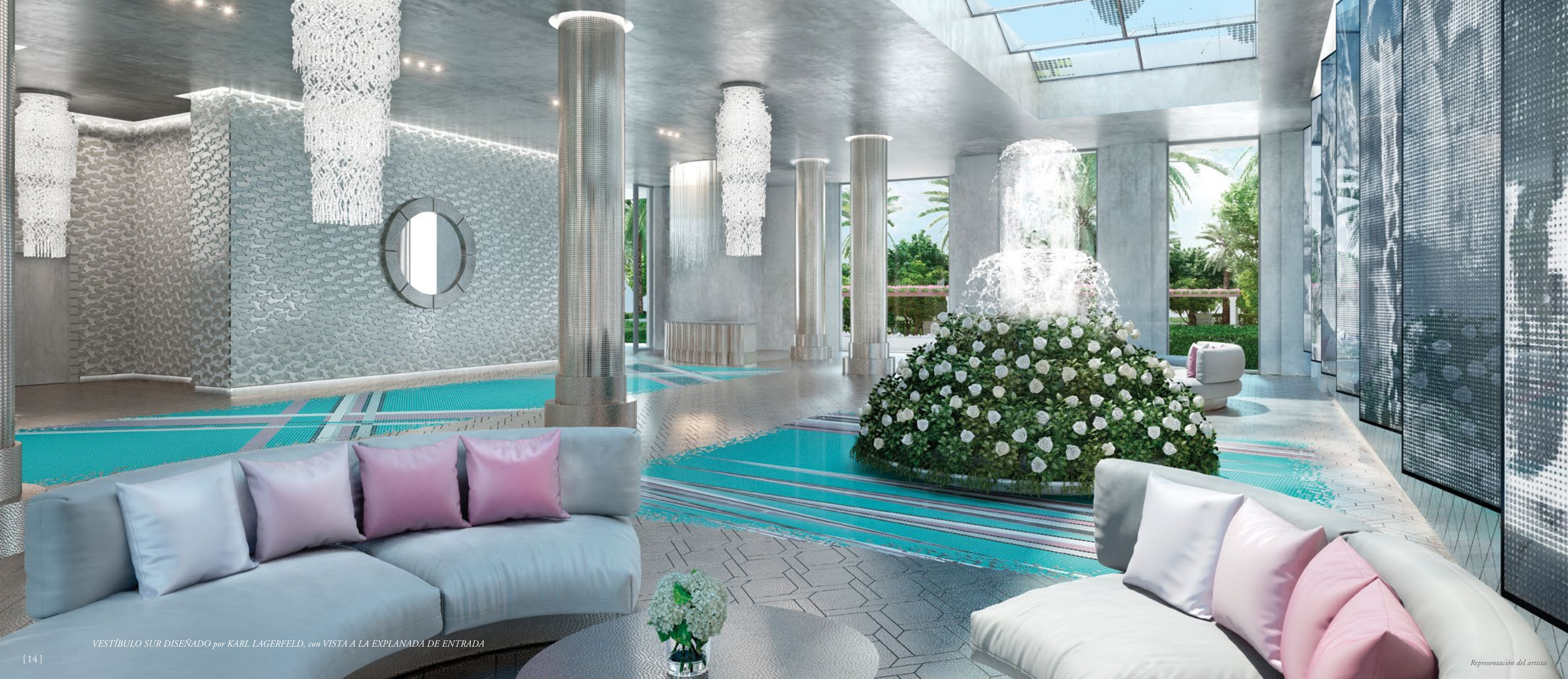
VESTÍBULO SUR DISEÑADO por KARL LAGERFELD, con VISTA A LA EXPLANADA DE ENTRADA