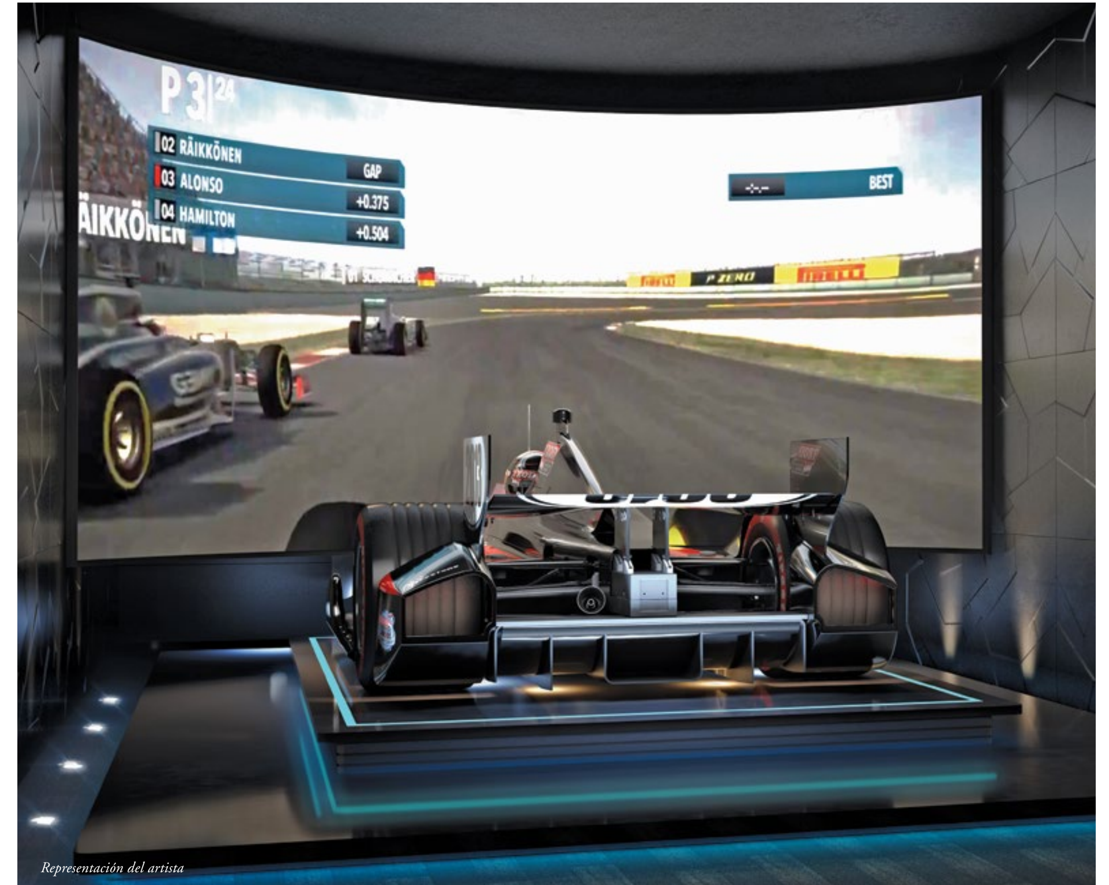
Representación del artista