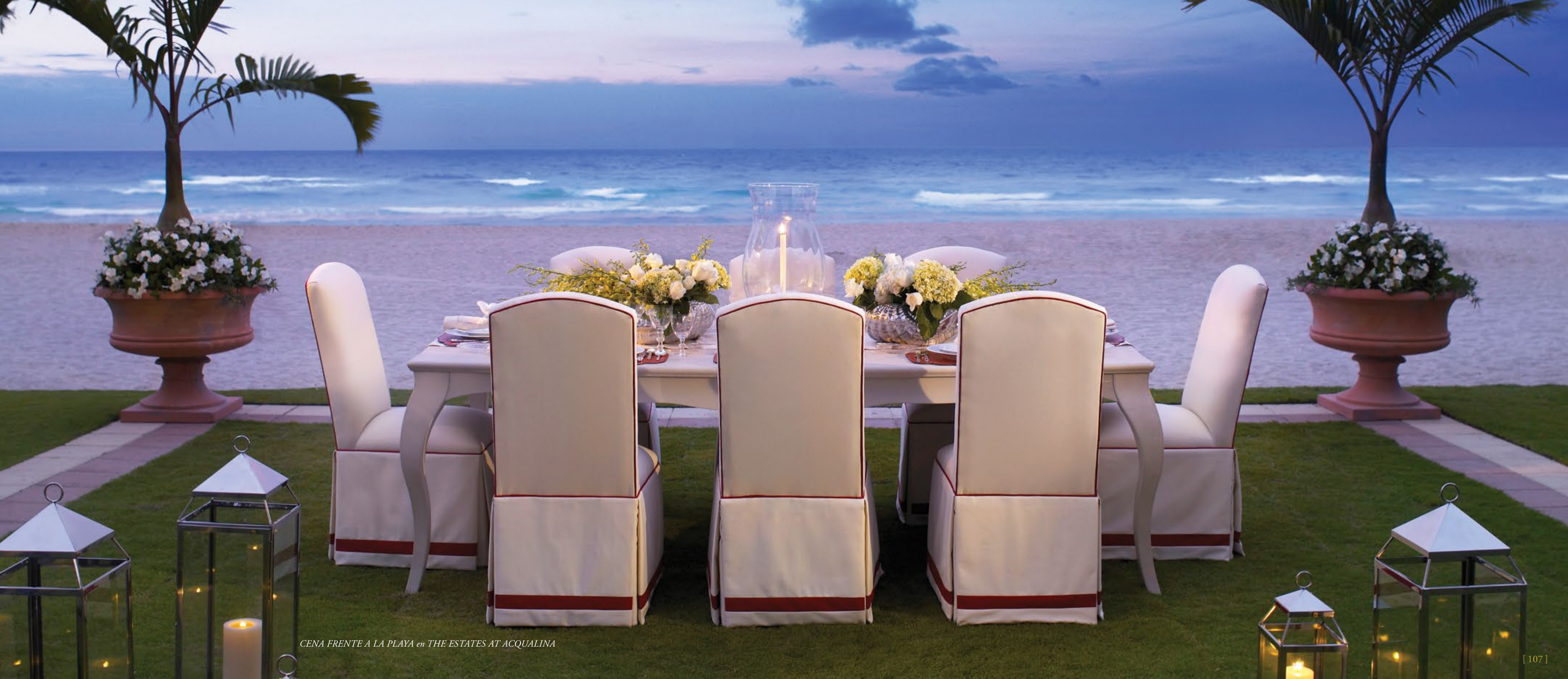
CENA FRENTE A LA PLAYA en THE ESTATES AT ACQUALINA