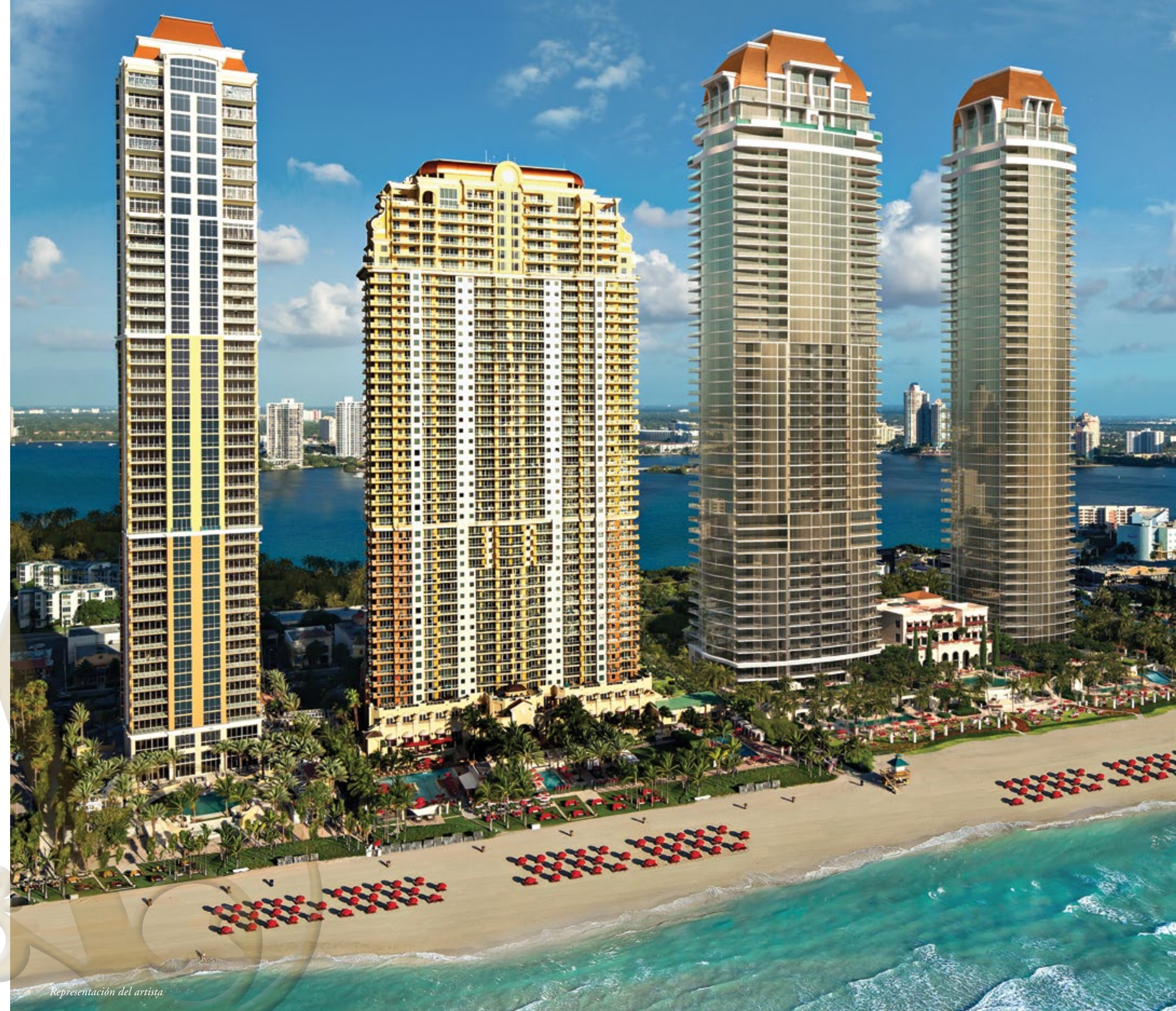
Representación del artista