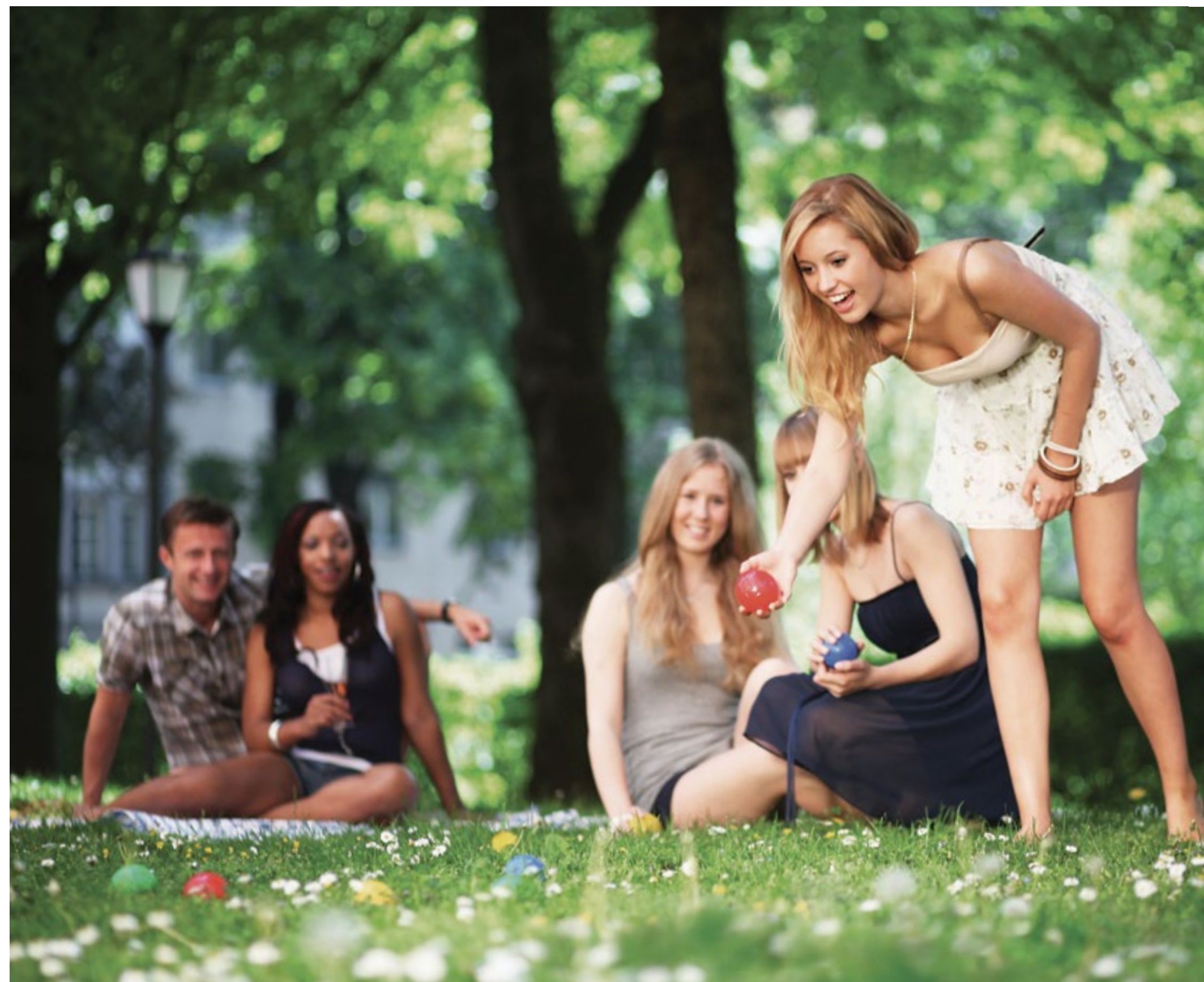
La CANCHA DE BOCHAS