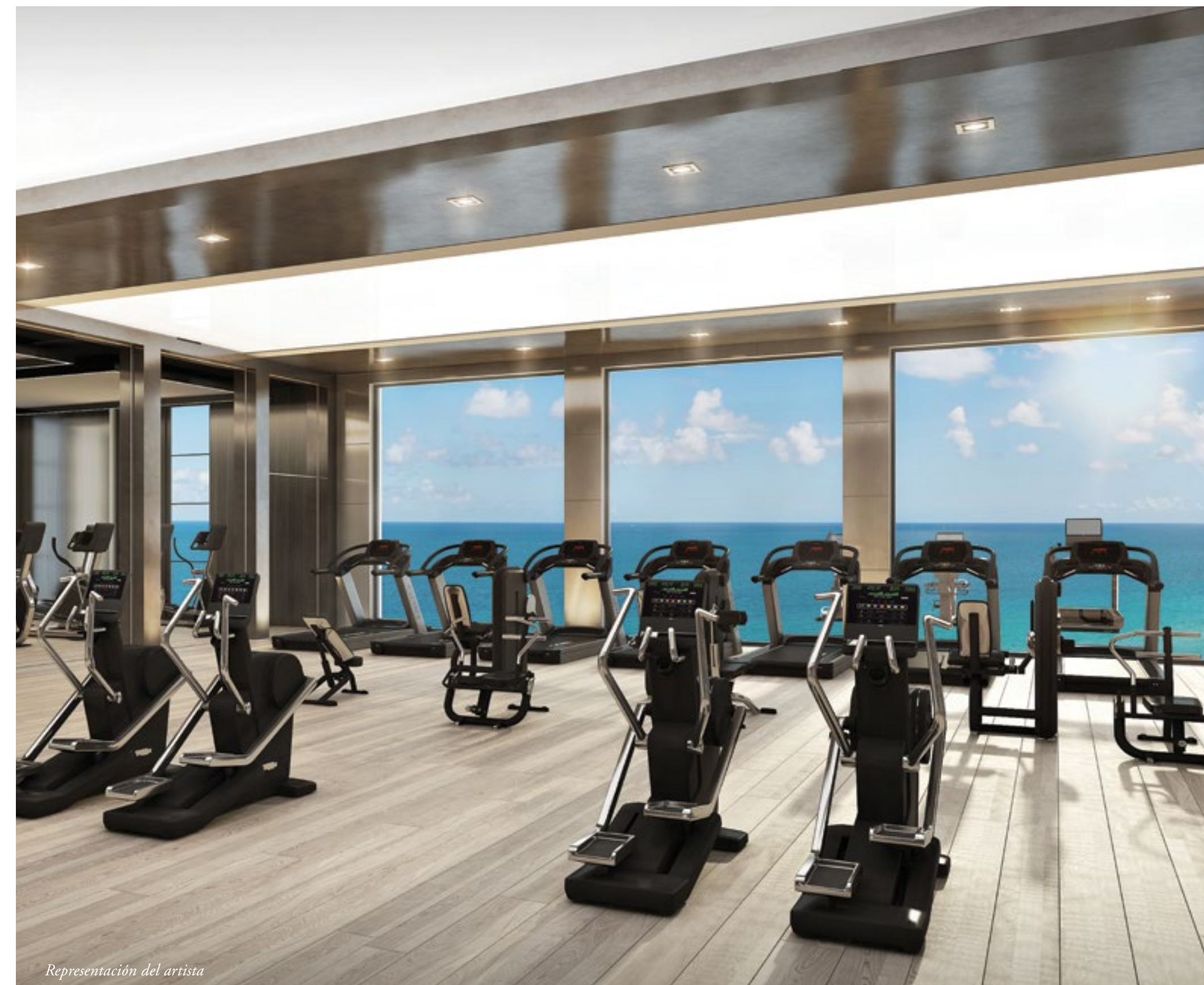
Representación del artista